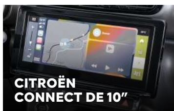
CITROËN CONNECT DE 10"