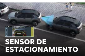
SENSOR DE ESTACIONAMIENTO